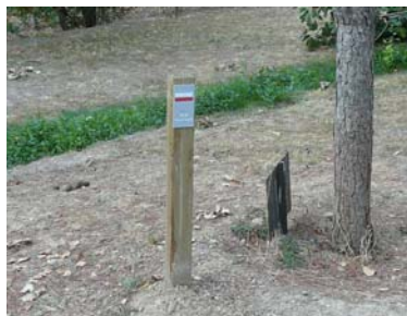
Baliza de señalización del sendero

A partir del recorrido del sendero GR-26 "Tierra de Campos" y del sendero GR-89 "Canal de Castilla", se ha diseñado una ruta circular cuyo punto inicial sería el área recreativa de Fuente el Sol. De allí parte la ruta en dirección a Fuensaldaña, por el GR-26 hasta Medina de Rioseco, donde enlaza con el GR-89 en la Dársena del canal, avanzando desde este punto por la orilla y pasando por los municipios de Fuentes de Nava, Capillas o Paredes de Nava hasta llegar a Palencia.