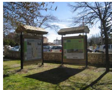
Dársena del Canal de Castilla en Palencia

En la provincia de Palencia se han considerado los tramos del GR-89 que discurren entre Belmonte de Campos y El Serrón (60,8 km correspondientes al Ramal de Campos del Canal de Castilla) y entre El Serrón y el límite con la provincia de Valladolid en el término municipal de Dueñas (32,1 km del Ramal Sur del Canal de Castilla).