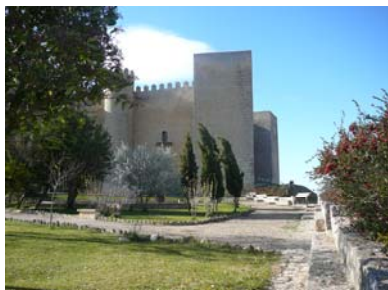
Castillo de Montealegre

Esta obra de señalización de dos senderos de gran recorrido se ha desarrollado dentro del convenio de colaboración entre la Obra Social "la Caixa" y la Fundación del Patrimonio Natural de Castilla y León para la conservación y mantenimiento de los espacios naturales de la comunidad autónoma.