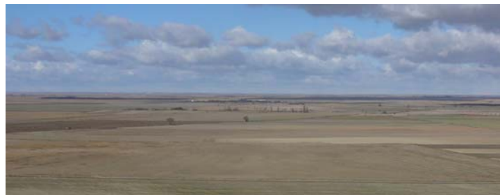
Paisaje de Tierra de Campos

La longitud total de este itinerario es de aproximadamente 176,5 km.