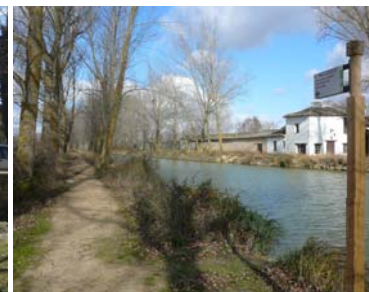
Dársena del Canal de Castilla en Medina de Rioseco